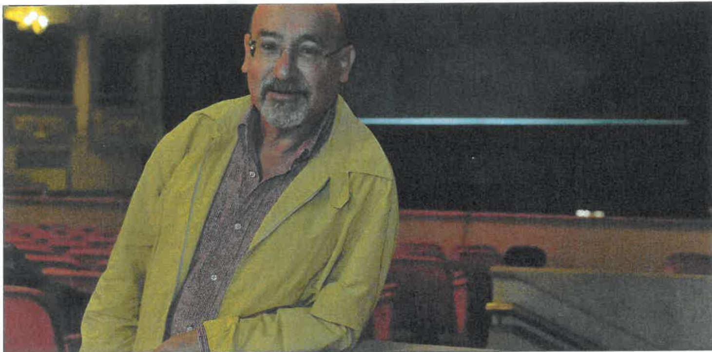
Salvatore Sciarrino, il 28 aprile a Pordenone riceverà il Premio Nazionale "Educare alla musica" Pia Baschiera Tallon

In queste pagine pubblichiamo, compatibilmente con lo spazio disponibile, esclusivamente i programmi che arrivano alla nostra redazione per posta, fax o e-mail all'indirizzo calendario@belviveremedia.com entro il giorno 20 di due mesi prima dell'uscita del numero; ad esempio, il 20 aprile si chiude la raccolta dei materiali per il numero di giugno