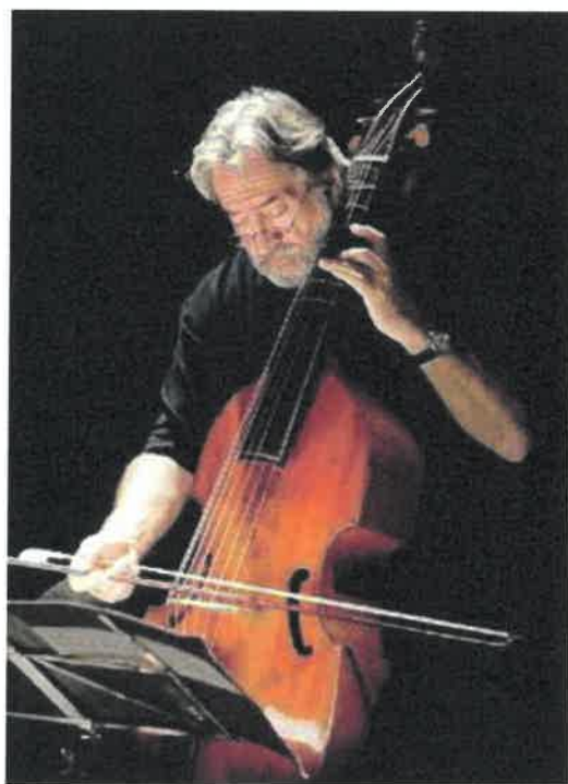
CONCERTO DA RECORD Jordi Savall tornerà a Pordenone il 20 novembre con un concerto dedicato alla musica turca antica

- Ci può dare una panoramica su quanto ci aspetta? «Un po' di tutto: c'è il pop, non solo per i Carmina Burana, penso al concerto forse più atteso, quello con Jordi Savall (musicista con il record assoluto di maggiore pubblico per la musica al Verdi) che tornerà il 20 novembre con il suo ensemble Hesperion XXI e