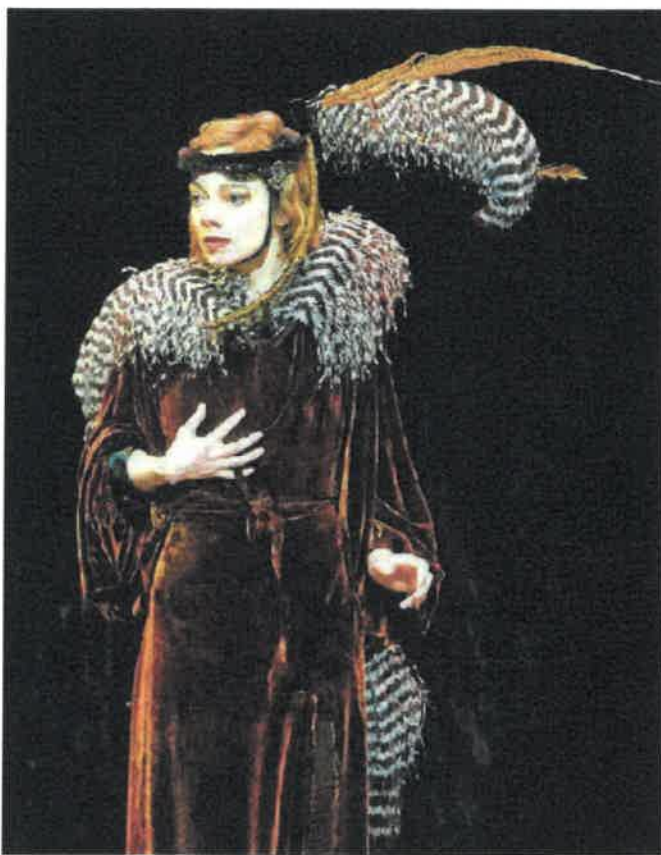
Aurélia Thierrée diretta dalla madre Victoria Chaplin reciterà a Pordenone

Ma al Verdi sono già aperte le prevendite per gli spettacoli di novembre: in pole position i biglietti per il cartellone di prosa, che si inaugura lunedì 2 novembre con "La ricotta", nell'ambito